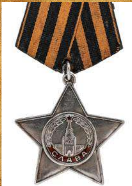
Орден Славы III степени

В бою по разгрому двух полицейских полков 8 июля 44г. на подступах к г. Лида принял участие в разгроме и пленении полицаяев. Лично из своего автомата убил 4-х и взял в плен 3-х немцев.