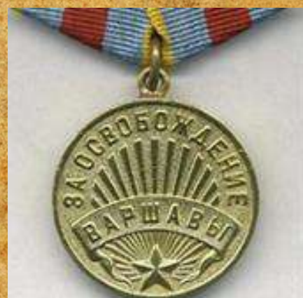
Медаль «За освобождение Варшавы»