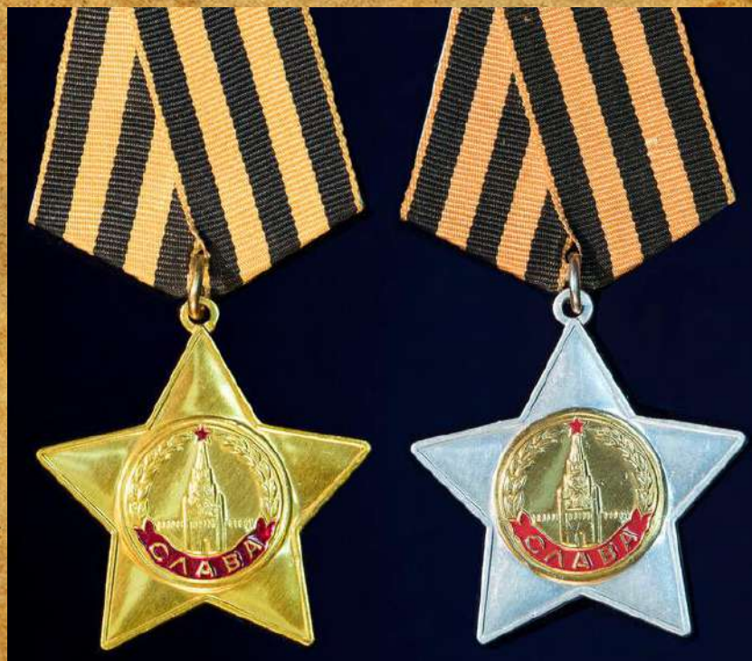
Ордена Славы I и II степени

29.03.45 года при прорыве обороны немцев в районе с.Киш (Венгрия) огнем Своего орудия, прямой наводкой уничтожил 4 станковых пулемета, 2 орудия ПТО, 3 миномета. Рассеял и уничтожил до 2-х взводов немецкой пехоты.