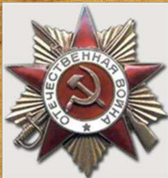
Орден Отечественной Войны I

Попал в плен по Сталинградом. После побега опять ушел в действующую армию. Был награжден орденом Славы III степени (в ожесточенном бою за населенный пункт Новый Двур (Чехия)). Медаль за отвагу в Венгрии за взятие языка. Орден Отечественной Войны I степени в бою за населенный пункт Чата (Венгрия).