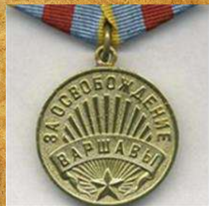
Медаль «За освобождение Варшавы»