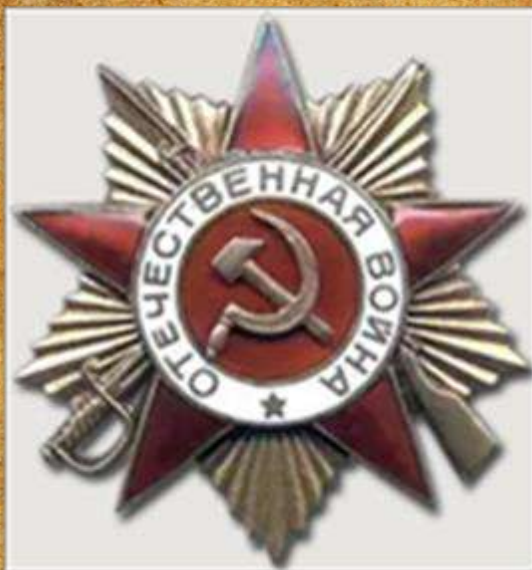
Орден Отечественной Войны II

За активное участие на фронтах Отечественной войны и три ранения полученных в боях достоин награждения орденом «Отечественной Войны II степени.