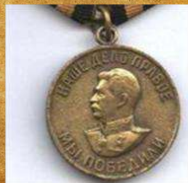
Медаль «За Победу над Германией в ВОВ»