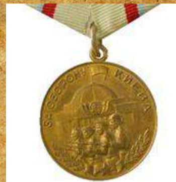
«За освобождение Киева»