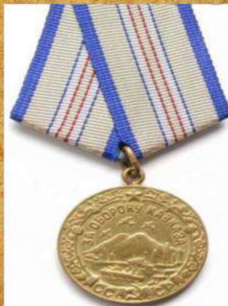
Медаль «За оборону Кавказа»

Был награжден медалью «За оборону Кавказа»