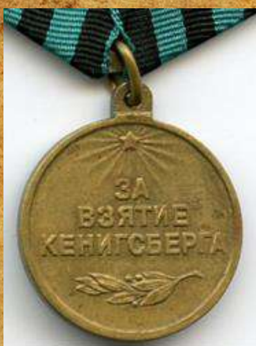
Медаль «За Взятие Кенигсберга»