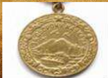
«За оборону Кавказа»