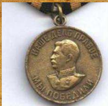
Медаль «За Победу над Германией в ВОВ»

Своевременно об этом доложил вблизи стоявшему танку, где танки Красной Армии открыли огонь, точно по указанной цели, что и дало возможность продвигаться в перед.