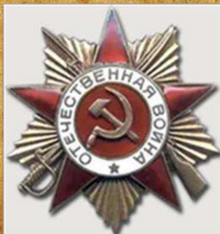
Орден Отечественной Войны I степени