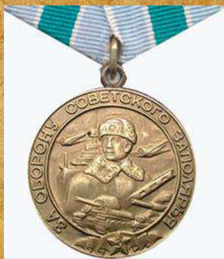
Медаль «За оборону Советского Заполярья»