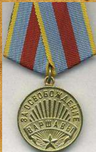
«За освобождение Варшавы»

На берегу Днепра воевал под командованием самого генерала армии Н. Ватунина.