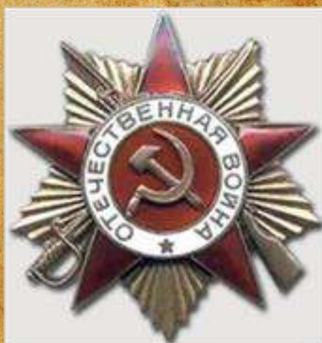
Орден «Отечественной Войны I степени»

Награжден орденом Отечественной Войны I степени.