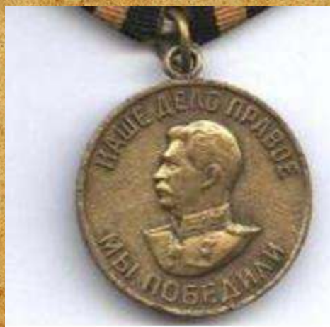
Медаль «За Победу над Германией в ВОВ»

Награжден медалью «За Победу над Германией в ВОВ»