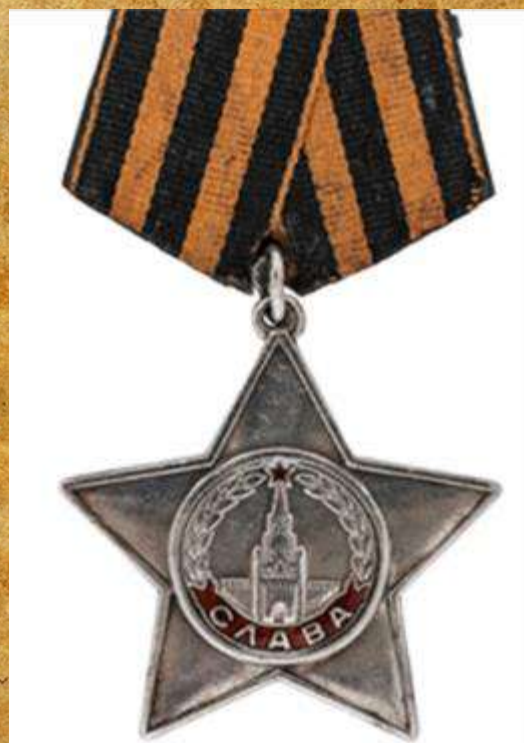
орденом Славы III степени