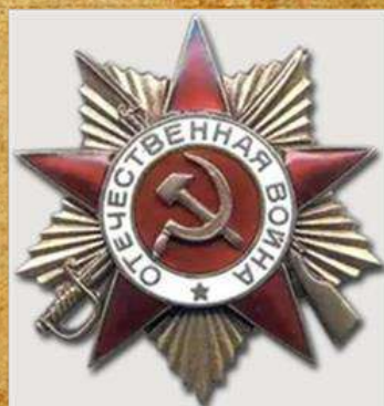
Орден «Отечественной Войны I степени»