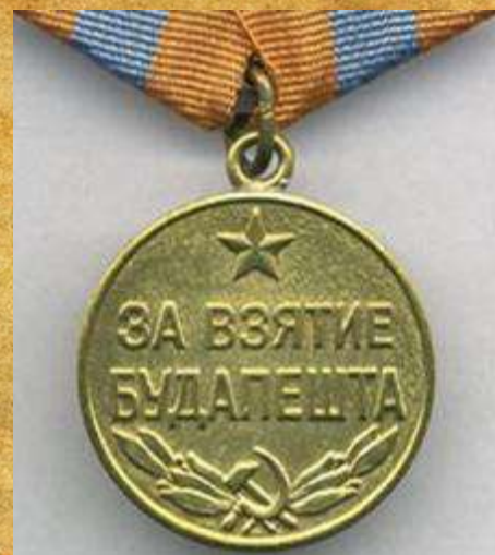
Медаль «За Взятие Будапешта»

В районе Шимонторня на проселке леса тов. Воронов был послан в разведку, где обнаружил один танковый пулемет и два ручных, стоявших во фланге.