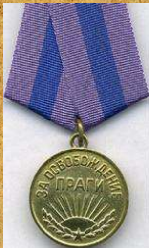
«За освобождение Праги»