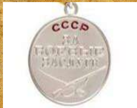
Медаль «За Боевые