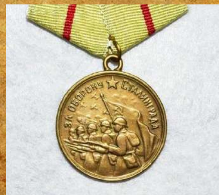
«За оборону Сталинграда»