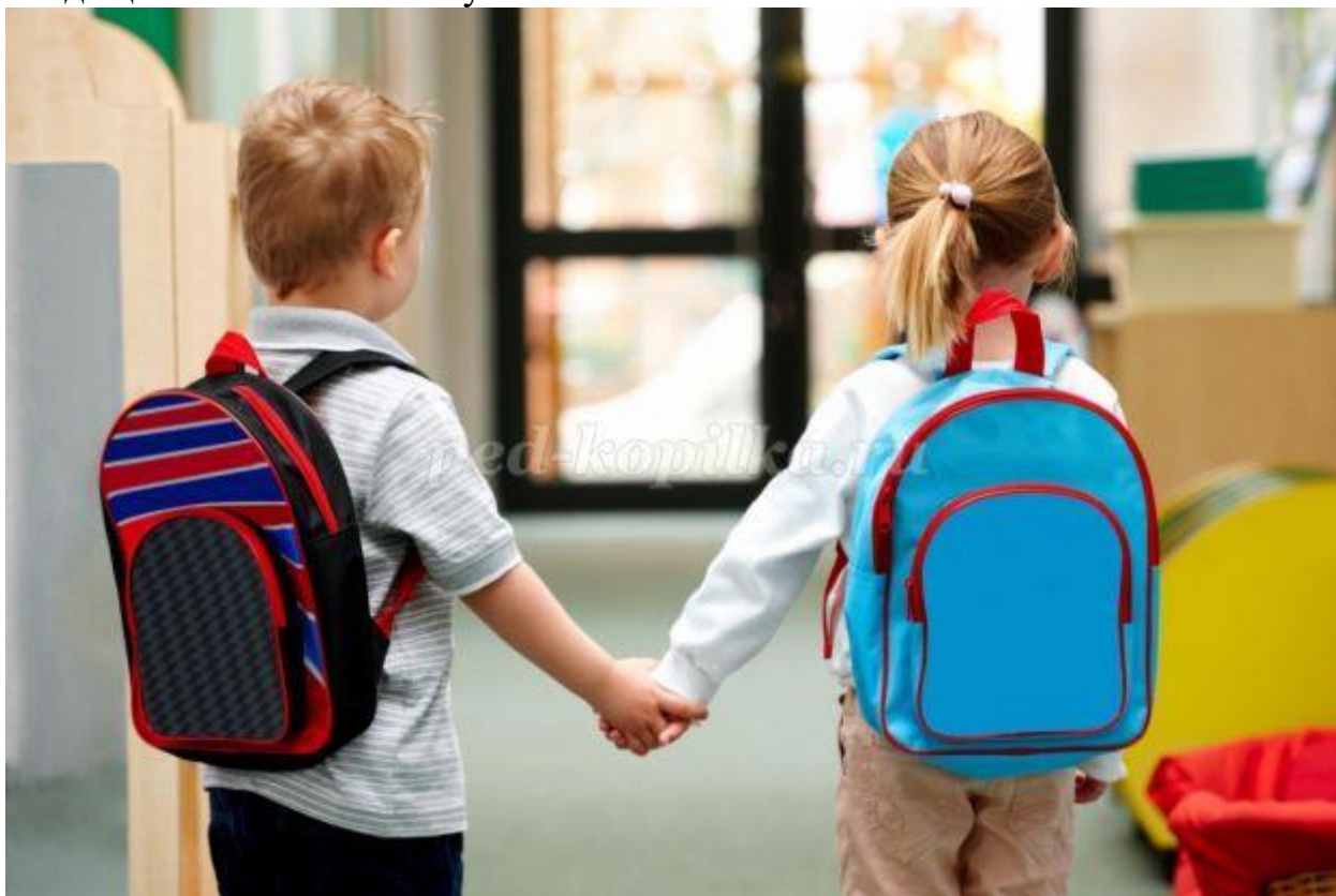
Мотивационная готовность детей к школе

Важная составляющая готовности к школе – мотивационная готовность, входящая в психологическую.